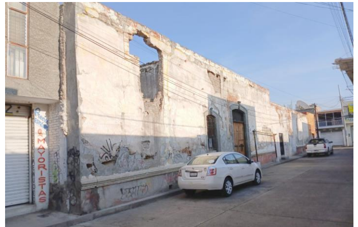
La vieja finca, ubicada en la calle Matamoros, esquina con Aldama, podría convertirse en un Tianguis de las Artesanías o Mercado para descentralizar el ambulante del centro histórico de Acámbaro.