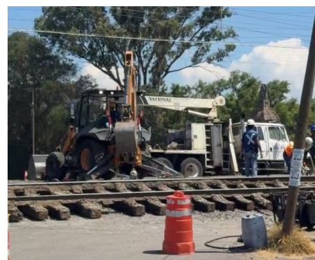
Los trabajos de mantenimiento de la KCS buscan evitar algún accidente del ferrocarril en la zona urbana de la localidad