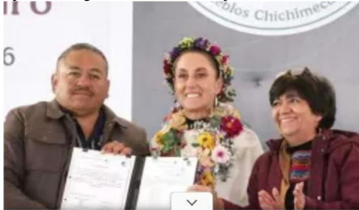
Claudia Sheinbaum ofreció apoyar los programas sociales de los pueblos originarios de los Estados de Guanajuato y Querétaro

el título de la propiedad por el ejido y cuyas autoridades recibieron las credenciales oficiales. Así, se reconoció el valor de estos pueblos originarios que en la región figuran 111 y que son olvidados ante el avance del “progreso” estatal que ‘alardea’ de inversiones y empleo para la industria automotriz y del zapato, entre otras, pero que olvida la cultura y los derechos indígenas. El Nuevo Ejido Cruz del Palmar mantuvo una disputa agraria durante los 80 años con el poblado de La Petaca, pero que ahora con el acuerdo para el Nuevo Ejido, este conflicto llegó a su fin y surgió la vía para la paz y la aplicación de programas sociales, incluyendo escuelas para preservar la lengua chichimeca y otomí. Por todo ello, la gira fue productiva, en donde Claudia Sheinbaum adquirió el compromiso de seguir atendiendo las necesidades de los pueblos originarios de México. Ojalá.