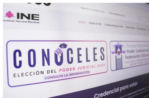
En la plataforma del INE: Conócelos, la población podrá saber de los aspirantes a un cargo en el Poder Judicial de la Federación

3.- Vigentes, las campañas de los ‘candidatos’ a cargos en el Poder Judicial.- Ya están en plena campaña, los aspirantes a un cargo en el Poder Judicial de la Federación, de hecho, el período oficial es del 30 de marzo al 28 de mayo. Los aspirantes habrán de convencer al electorado que son los mejores y que por ello, el o la ciudadana deben votar por ellos. Desde luego que hay ‘topes’ de campaña por una parte, y por otra, el Instituto Nacional Electoral (INE) apoya a los aspirantes con una amplia difusión para que el heroico y sufrido pueblo de México los conozca y los pueda favorecer con su voto el día de la jornada electoral, que es el primero de junio de 2025. La elección sin embargo, por sí misma, es y será compleja; pero el INE confía en que todo saldrá bien. Esperemos que el pueblo vote por los candidatos idóneos. Esperemos.