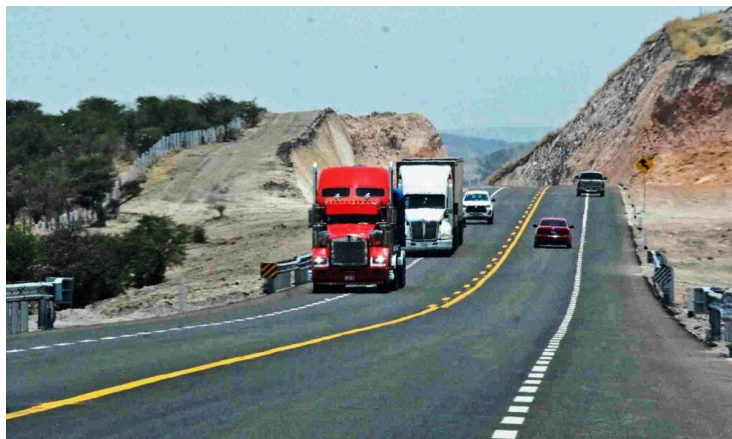
El Libramiento Sur-Oriente busca resolver el problema del tránsito ciudadano de Acámbaro