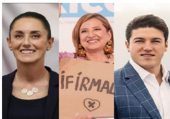
Claudia Sheinbaum (Morena), Xóchitl Gálvez (PAN) y Samuel García (MC) son los aspirantes al Palacio Nacional para el 2024

1.- Partidos definen a sus ‘abanderados’ a la Presidencia de la República.- En esta semana, los partidos políticos definieron a sus ‘abanderados’. Por un lado, la coalición de Morena, Verde y PT tienen a Claudia Sheinbaum; y por el otro, el Frente Amplio por México cuenta con Xóchitl Gálvez Ruíz. A ambas, se agrega para la contienda el Movimiento Ciudadano (MC) con el Gobernador de Nuevo León con licencia, Samuel García Sepúlveda. Uno de los tres será el próximo Jefe del Ejecutivo Federal. Habrá sin embargo, una contienda muy cerrada al final del camino y no se descartan sorpresas. Morena cree tenerlo todo bajo control y el Frente Amplio por México “va de menos a más”. Faltan más de seis meses y medio para la jornada electoral del 2 de junio y con datos duros de encuestas serias y la evaluación prudente de analistas, bien puede decirse que no hay nada escrito para nadie. Todo puede suceder, esperando que si Morena pierde, el Presidente Andrés Manuel López Obrador –mejor conocido como “El Peje”-, reconozca el resultado. Y es que cuando gana, todo estuvo bien; y cuando pierde, todo está mal. El pueblo tiene la última palabra en las urnas. Ya veremos.