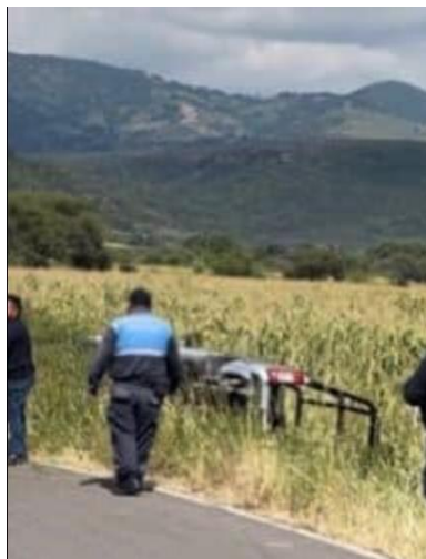
Patrulla de la policía volcada, a un costado del camino entre “El Piloncillo” y “Moncloa”