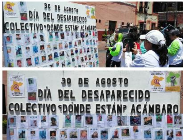
El Colectivo “¿Dónde están?, Acámbaro” mostró fotografías de los desaparecidos; habría más de 160