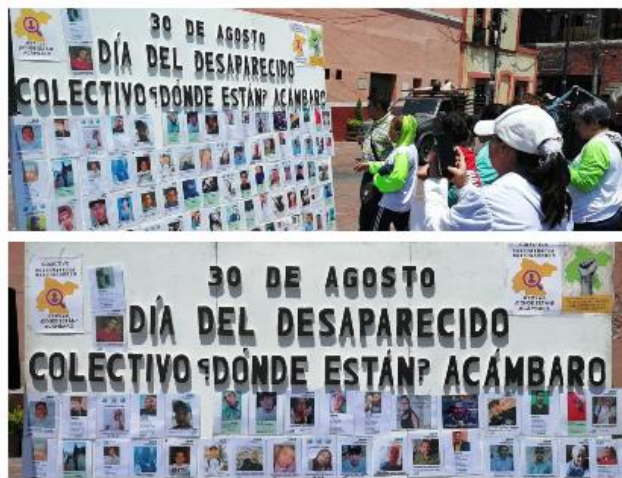
El Colectivo “¿Dónde están?, Acámbaro” mostró fotografías de los desaparecidos; habría más de 160